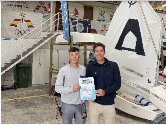
Visita a Real Club Náutico de Laredo