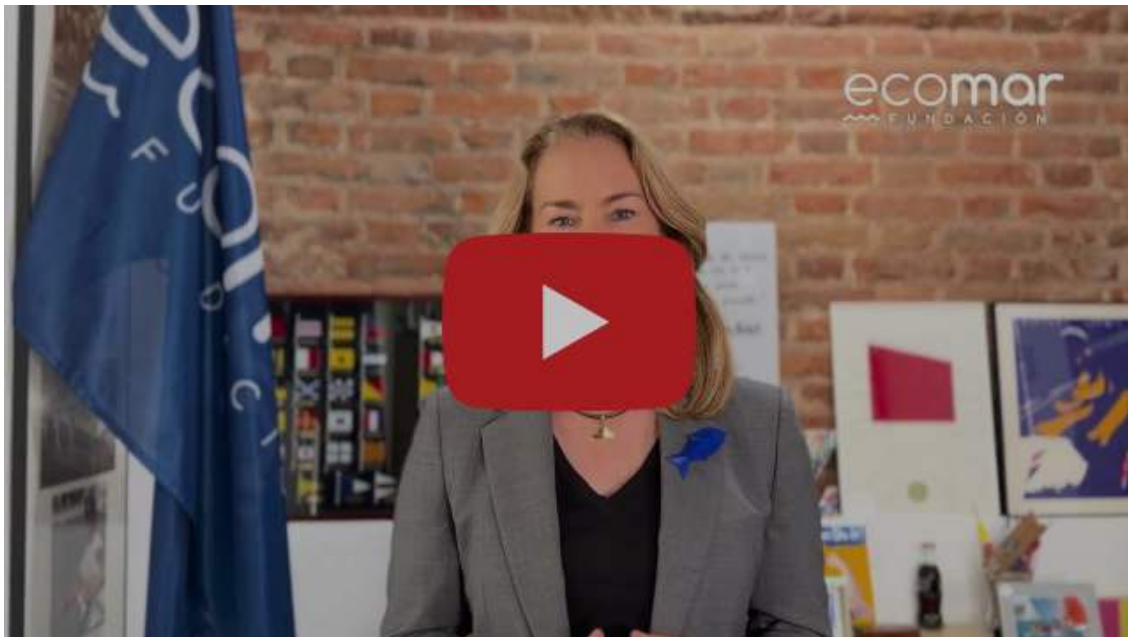
Theresa Zabell pone voz al Día Mundial de los Océanos