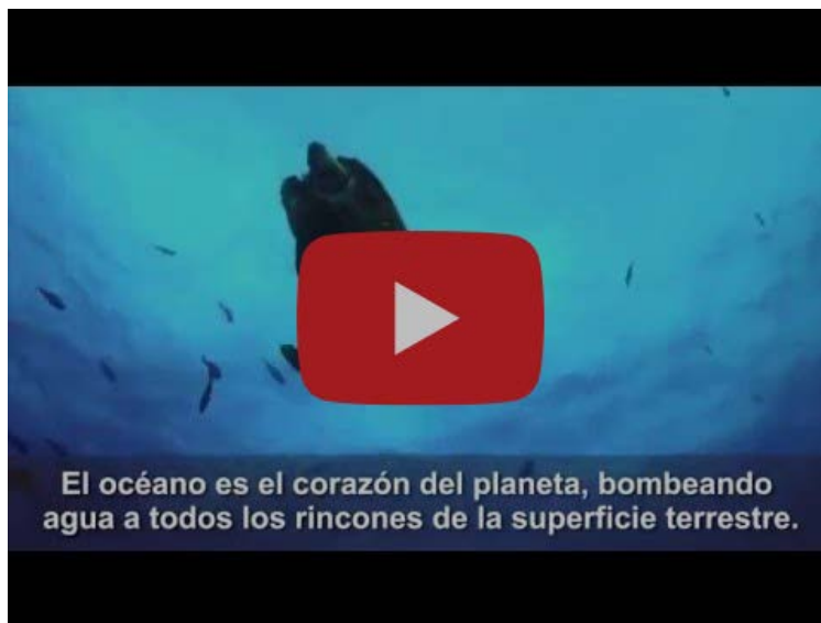
Video distribuido por la ONU sobre los océanos

La Fundación Ecomar es una de las pocas en el mundo que pertenece al Programa de las Naciones Unidas para el Medio Ambiente y el próximo día 27 estaremos en la Conferencia de las Naciones Unidas sobre los Océanos en Lisboa , la capital de Portugal. La Conferencia sobre los Océanos, copatrocinada por los Gobiernos de Kenia y Portugal , se celebra en un momento crítico en el que el mundo trata de resolver los numerosos y profundos problemas de nuestras sociedades que la pandemia del COVID-19 ha puesto al descubierto.